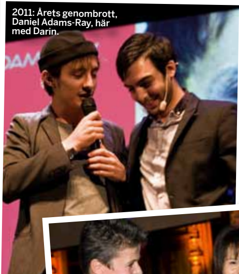
2011: Årets genombrott, Daniel Adams-Ray, här med Darin.